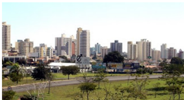
Forte Interior: Bauru, há 345 km de São Paulo: Pólo em Tecnologia da Informação