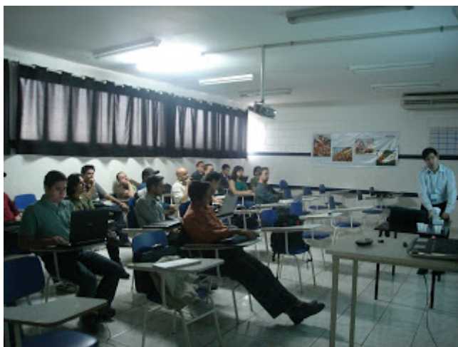
Hora do Celebrite.

Sem mais, vamos para a prática, se lá em San Francisco a polícia tem, aqui também, temos! Algumas fotos do II Curso de Perícia Computacional no Interior de São Paulo, realizado no coração do Estado, Bauru, com aproximadamente 400 mil habitantes: