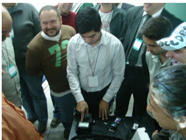
Foram encontradas coisas interessantes